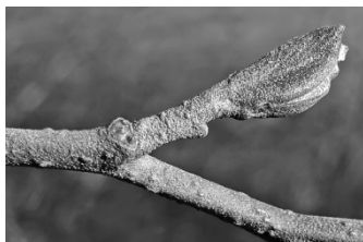
Knospe der Schwarzerle